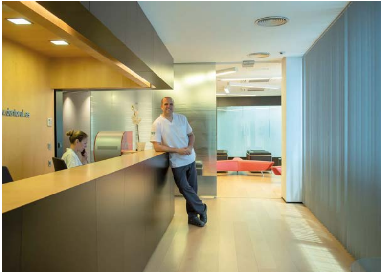
La adaptación a los avances tecnológicos supone también un cambio en el modo de trabajar de todo el equipo de la clínica.

hasta el final (planos canteados, líneas medias no centradas...), obligándonos a hacer muchos más refinamientos de los que a día de hoy tenemos que realizar».